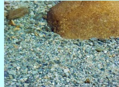
川上川 の澄んだ水