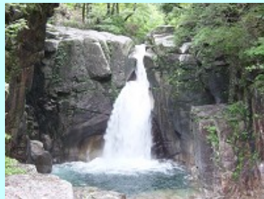
夕森公園内の『龍神の滝』 (龍神伝説がある)